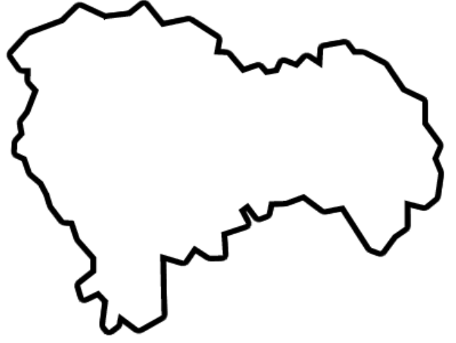
Cabanillas del Campo (ES)