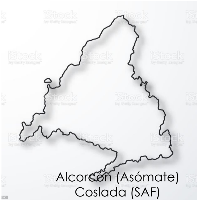
Alcorcón (Asómate) Coslada (SAF)